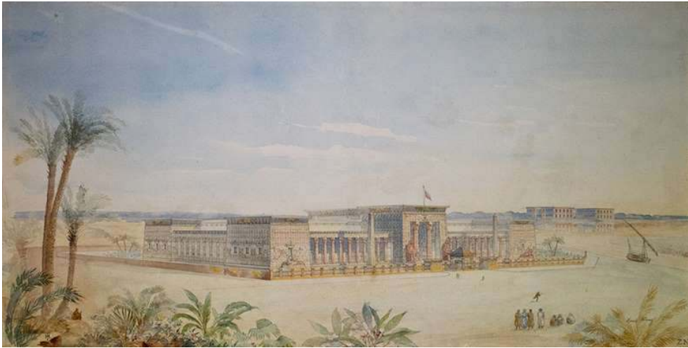
Figure 4 : Henri Fivaz, Projet de musée des antiquités égyptiennes : vue perspective, 1894.