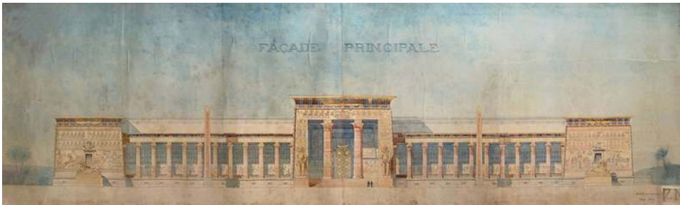
Figure 3 : Henri Fivaz, Projet de musée des antiquités égyptiennes : façade principale , 1894.