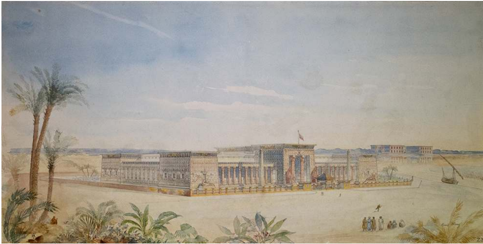
Figure 4 : Henri Fivaz, Projet de musée des Antiquités égyptiennes : vue perspective, 1894.