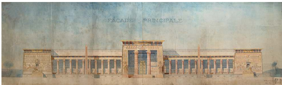
Figure 3 : Henri Fivaz, Projet de musée des Antiquités égyptiennes : façade principale , 1894.