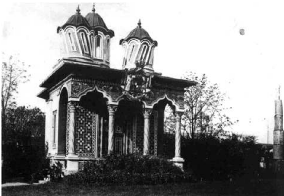
Bibliothèque de l'Académie roumaine, section des Estampes.