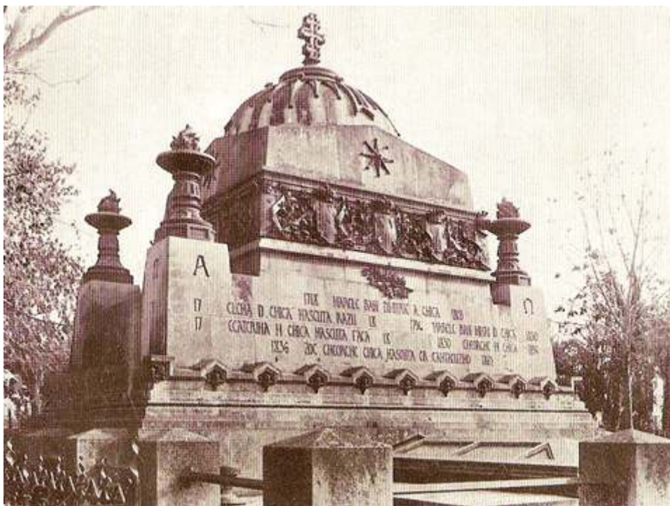
Arhitectura , 1, 1941, p. 32.