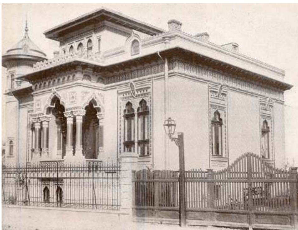
Arhitectura , 1, 1941, p. 60.