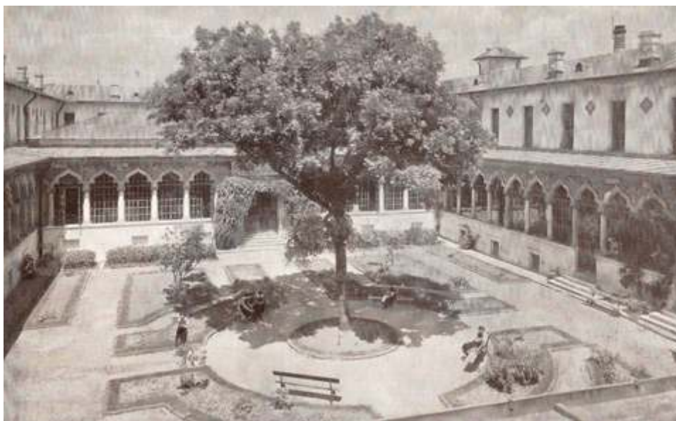
Arhitectura , 1, 1941, p. 34.